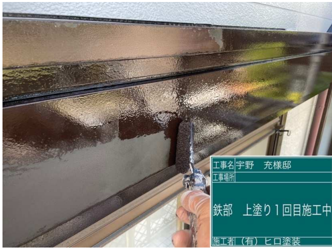
33 鉄部 上塗り1回目 施工中