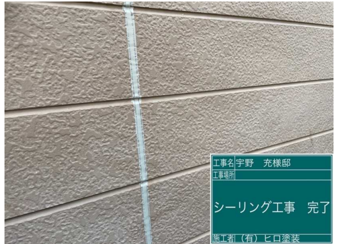
8 コーキング 施工完了