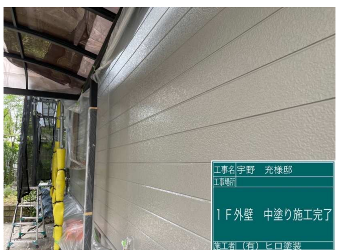
24 1F外壁 中塗り 施工完了