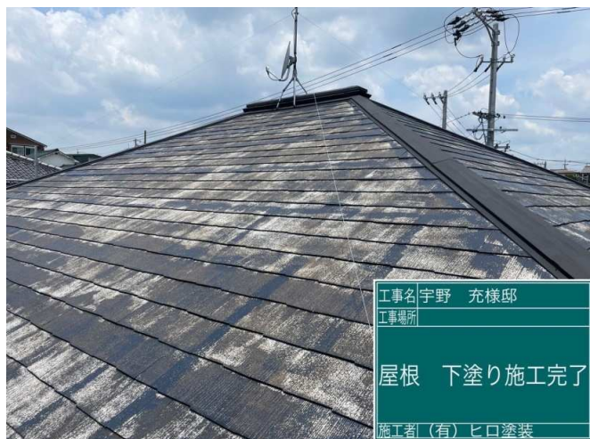
38 屋根 下塗り 施工完了