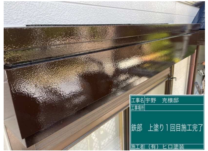
34 鉄部 上塗り1回目 施工完了