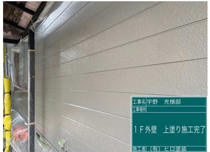
26 1F外壁 上塗り 施工完了