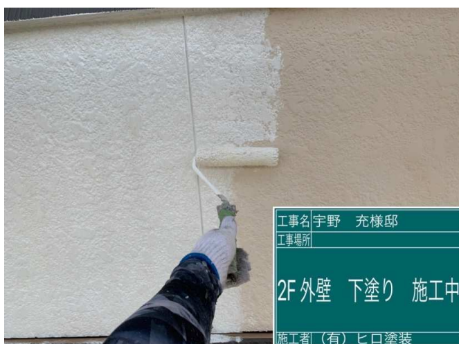
15 2F外壁 下塗り 施工中