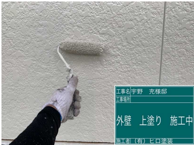
19 2F外壁 上塗り 施工中