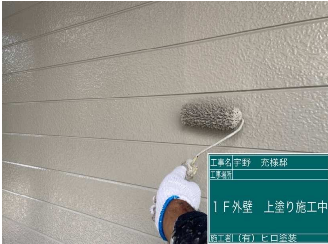
25 1F外壁 上塗り 施工中