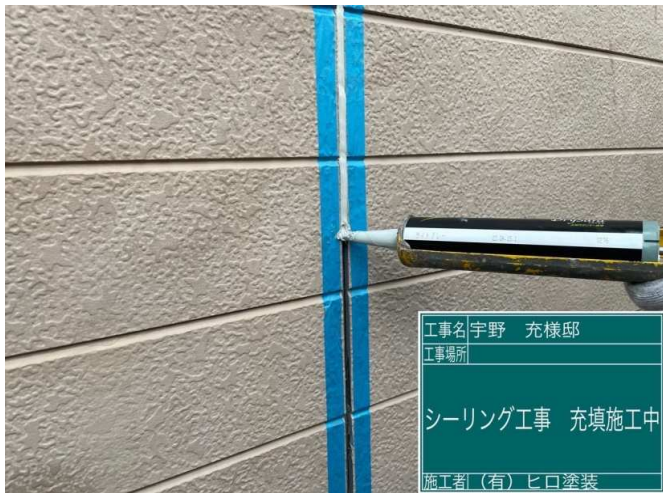
7 コーキング 施工中