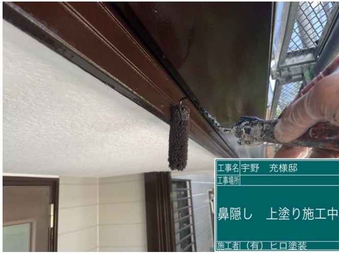
31 鼻隠し 上塗り 施工中