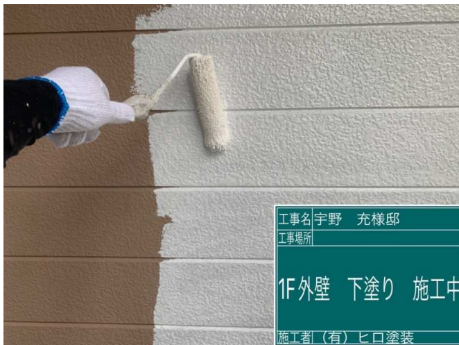
21 1F外壁 下塗り 施工中