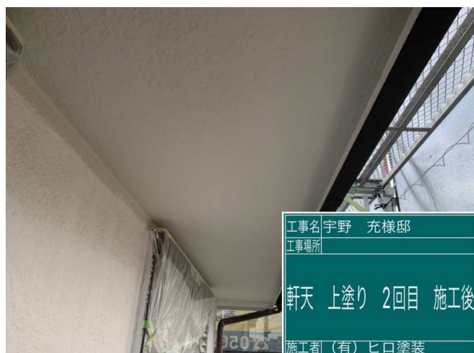
14 軒天 上塗り 2回目 施工完了