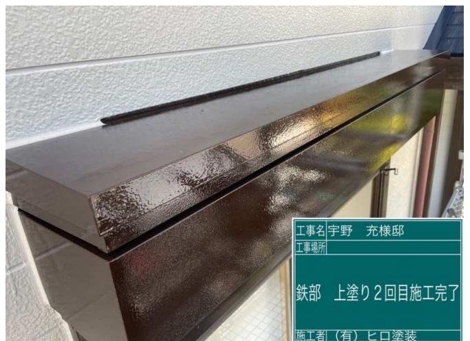
36 鉄部 上塗り2回目 施工完了