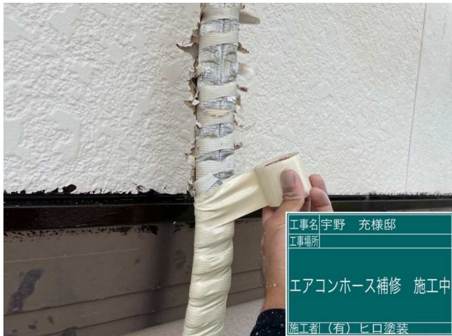
9 エアコンホース補修 施工中