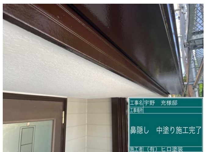
30 鼻隠し 中塗り 施工完了