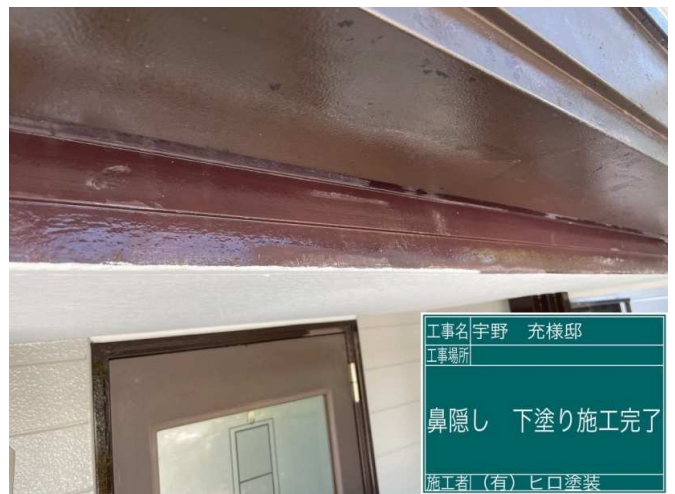
28 鼻隠し 下塗り 施工完了