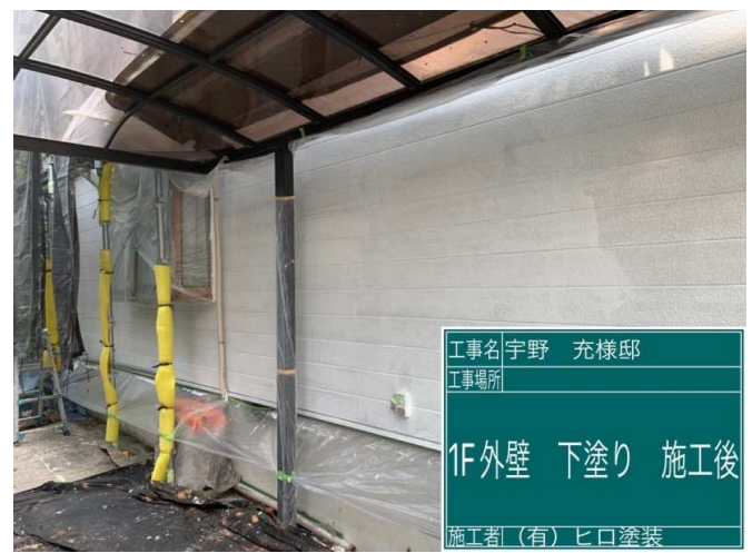
22 1F外壁 下塗り 施工完了