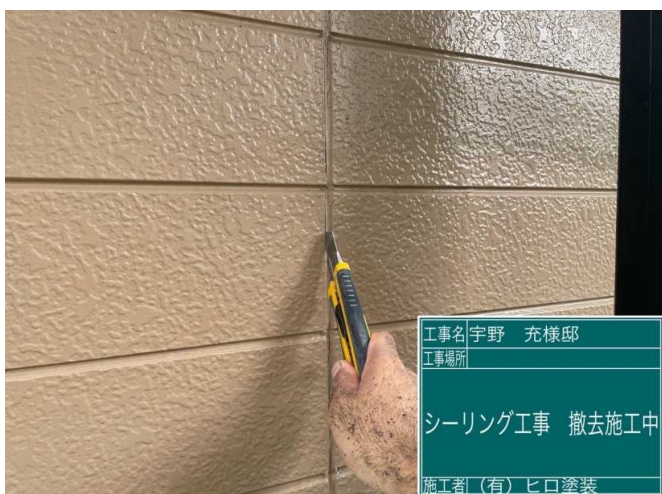
5 既設コーキング撤去 施工中