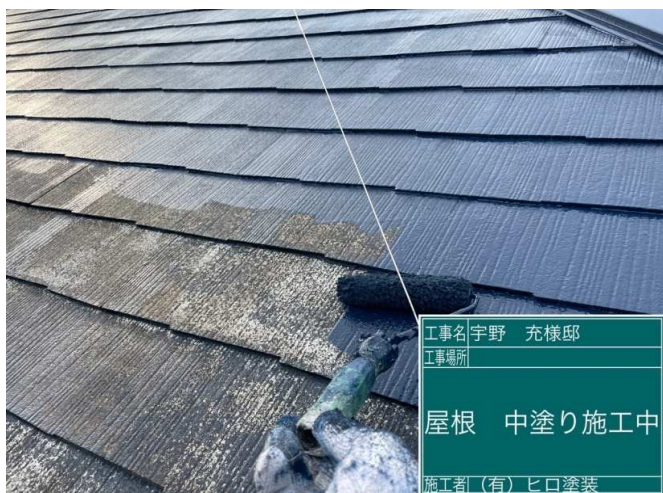
39 屋根 中塗り 施工中