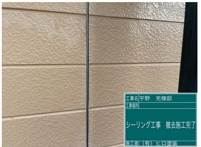
6 既設コーキング撤去 施工完了