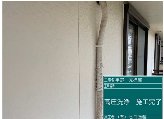
4 外壁 高圧洗浄 施工完了