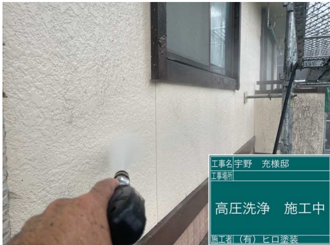
3 外壁 高圧洗浄 施工中