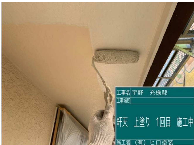
11 軒天 上塗り 1回目 施工中