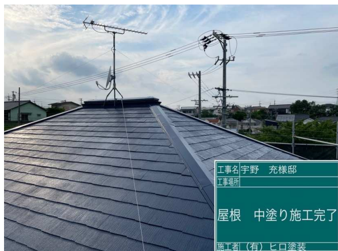
40 屋根 中塗り 施工完了