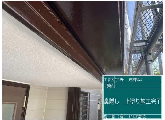
32 鼻隠し 上塗り 施工完了