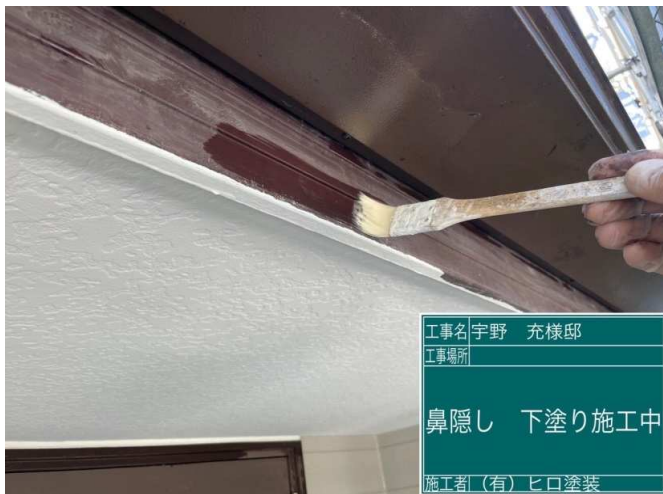
27 鼻隠し 下塗り 施工中