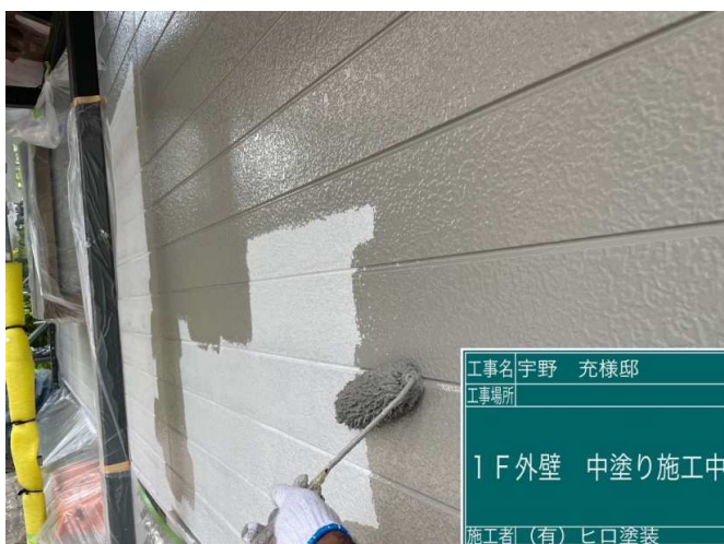
23 1F外壁 中塗り 施工中