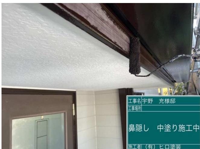
29 鼻隠し 中塗り 施工中