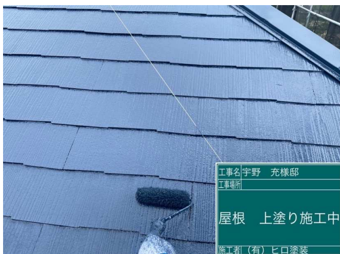
41 屋根 上塗り 施工中