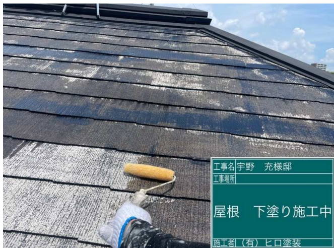
37 屋根 下塗り 施工中