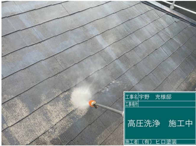
1 屋根 高圧洗浄 施工中