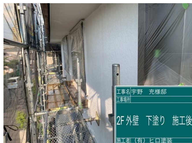
16 2F外壁 下塗り 施工完了