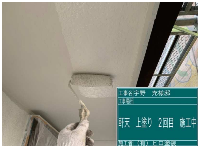
13 軒天 上塗り 2回目 施工中