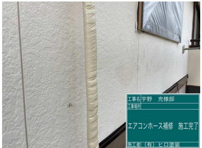
10 エアコンホース補修 施工完了