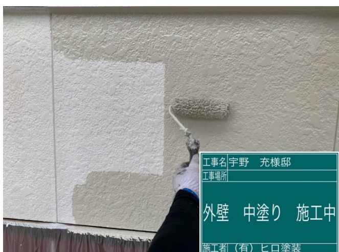
17 2F外壁 中塗り 施工中