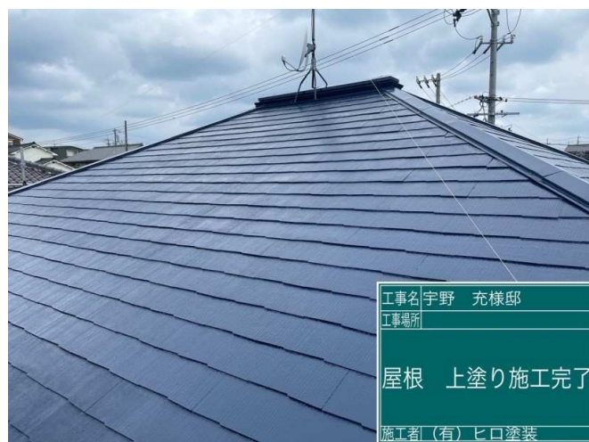
42 屋根 上塗り 施工完了