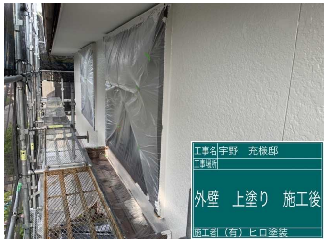
20 2F外壁 上塗り 施工完了