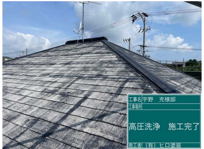
2 屋根 高圧洗浄 施工完了