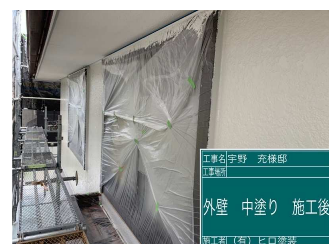
18 2F外壁 中塗り 施工完了