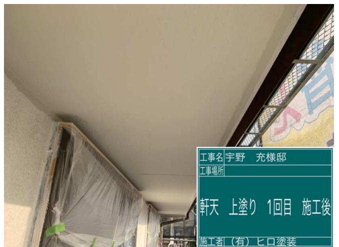
12 軒天 上塗り 1回目 施工完了